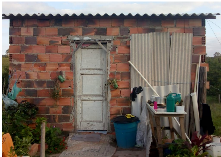
Figura 1. Casa participante do Programa Emboço Social antes do emboço.

O programa busca promover atitudes sustentáveis em seus parceiros comerciais, bastando fechar o círculo da sustentabilidade: a cada 100 sacos recolhidos das obras, um saco de 50kg de massa pronta para emboço é doado para proteger moradias de famílias cadastradas no programa, em Itaboraí. Em média, 50 sacos de 50kg de emboço são necessários no revestimento externo de uma moradia socialmente desfavorecida. Portanto, a cada 5.000 sacos recuperados, uma família é protegida. Nas figuras 1 e 2 é possível avaliar o antes e o depois de uma casa participante do PES, em Itaboraí.