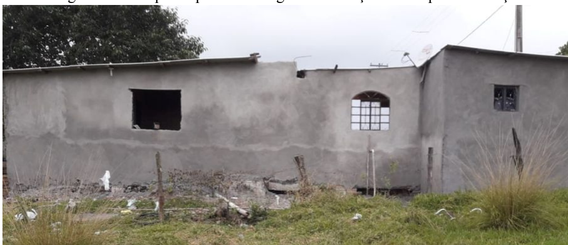
Figura 6. Casa participante do Programa Emboço Social após o emboço.