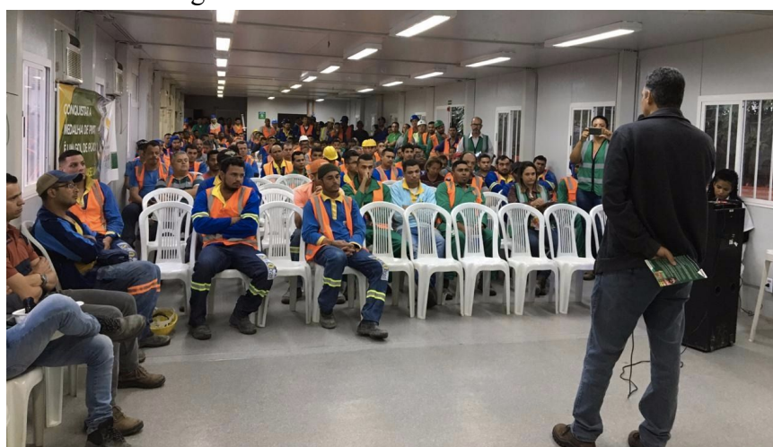
Figura 3. Palestra em canteiro de obras.

Ao buscar seu ecodesenvolvimento, a empresa reforça que todos os níveis e setores devem compreender a necessidade e importância em armazenar e devolver as sacarias usadas. Para isso, além do contato constante com a gerência das obras, também são realizadas palestras de conscientização e incentivo à devolução dos sacos, com todos os colaboradores e subempreiteiros, com sorteio de brindes e cestas básicas (figura 3). Nas palestras, também divulgados os resultados do PES, com exibição de imagens e resultados do antes e o depois das casas que participaram do programa.