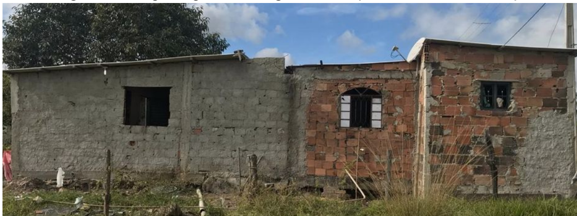
Figura 5. Casa participante do Programa Emboço Social antes do emboço.