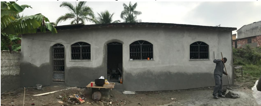
Figura 8. Casa participante do Programa Emboço Social Interno durante o emboço.