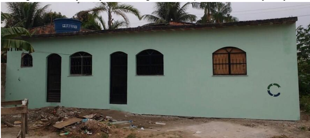
Figura 9. Casa participante do Programa Emboço Social Interno após a pintura.