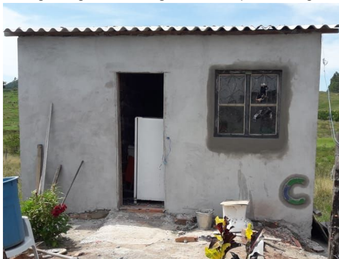
Figura 2. Casa participante do Programa Emboço Social após o Emboço.