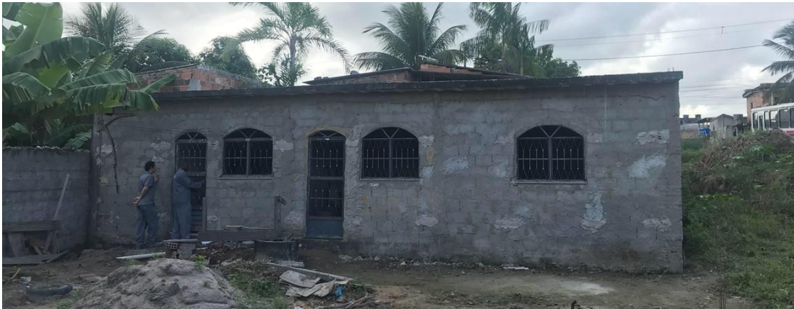
Figura 7. Casa participante do Programa Emboço Social Interno.

que foram beneficiadas pelo programa. As figuras 7, 8 e 9 mostram o antes e o depois do PES Interno e após a Vaquinha, respectivamente, da moradia de um funcionário da Riomix.